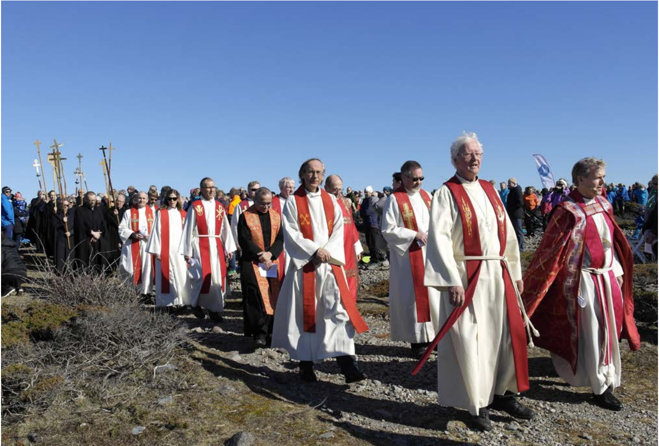
Biskop og prestar ved ei markering for Olav den heilage – alle med raude stolaar.

Johannes vart etter kvart sett i fengsel. Han vart drepen og vart derfor ein kristen martyr. I ein del kyrkjer er det gudsteneste på sankthans. Da har presten raude band over prestekjolen. Desse banda er kalla stola. Dei er raude fordi raudt er fargen for martyrdøden.