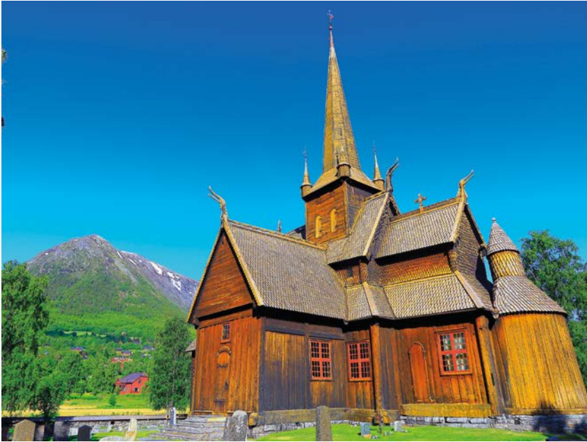
Lom stavkyrkje frå om lag 1170.

kvart som folk fekk kristne tankar og verdiar, endra dette seg. Med kristendommen fekk kvart enkelt menneske ansvaret for sitt eige liv og sine eigne val. Det var ikkje lenger så viktig å vere ein del av ei stor slekt, og hemn vart ikkje akseptert. Kristne tankar og verdiar vart også grunnleggjande i dei norske lovene.