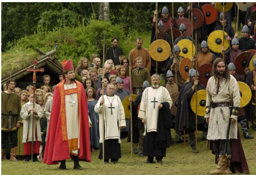
Frå Olavsspillet på Stiklestad som viser kva som hende da Olav døydde.

Olav den heilage er ein helgen, det betyr at han er ein heilag person. Han er Noregs vernehelgen, det vil seie at han vernar eller passar på landet vårt. Han blir også rekna som Noregs evige konge. Olav den heilage er også viktig i andre land, som i Frankrike og England. På Færøyane er det store folkefestar kvar olsok. I Den katolske og Den ortodokse kyrkja er Olav den heilage ein viktig helgen. Tre katolske kyrkjer i Noreg er innvigde til Olav den heilage. Dei ligg i Oslo, Trondheim og Tønsberg.